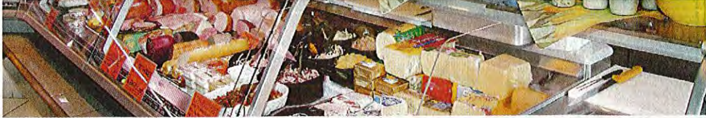
In der dritten Generation stellen die Weipperts Wurst her